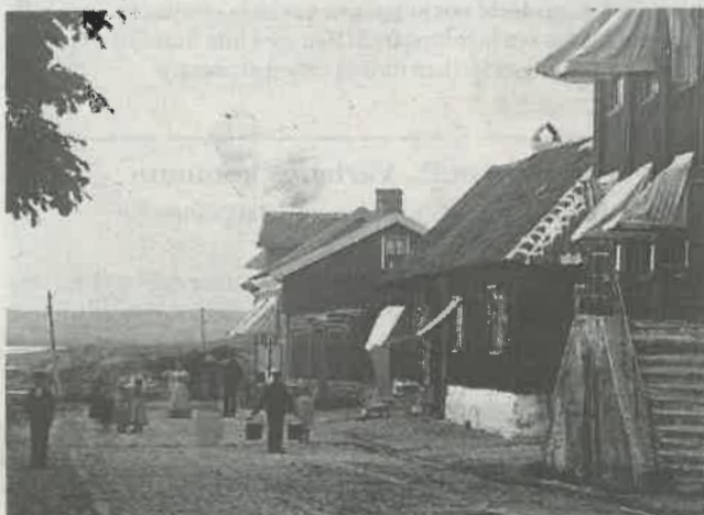
Västra Vallgatan och till höger i bild syns Gästishuset. Fotografiet är från före 1880 för här finns ingen järnväg och inget stationshus.