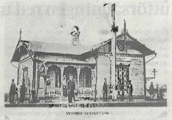
Järnvägsstationen i Veddige. På alla stationer skulle tåget lastas och lossas med varor. Inte undra på att resan tog tid – nästan fyra timmar i början.